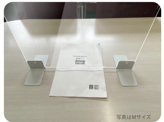
スタンドの取付位置は2段階で調整可能。 書類などの受け渡しスペースも確保できます。